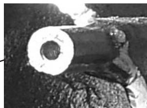
Particolare aggancio pistone superiore (per estremità A pistone)