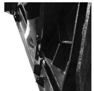
Barra di sicurezza