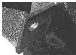
Particolare aggancio pistone inferiore (per estremità B pistone)